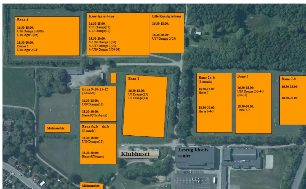
Eksempel på træningsplan for efteråret 2021. Muligheden for at afvikle kampe på hverdage eller for at træne på fuld bane el.lign. er yderst begrænset. Fra november er kun kunstgræsbanen og lille kunstgræsbane tilgængelig.

I regnvejrperioder må IF Lyseng ofte aflyse træning/kampe på græs for at beskytte de hårdt belastede græsbaner. Endnu en stor udfordring for klubben er manglende mulighed for at afvikle turneringskampe på hjemmebane på hverdage på grund af den høje træningsbelastning på banerne og manglen på kunstgræs/lys. Dette forhold giver ofte store praktiske udfordringer med at få programsat træningskampe uden for sæsonen eller turneringskampe i ofte komprimerede sæsonforløb.